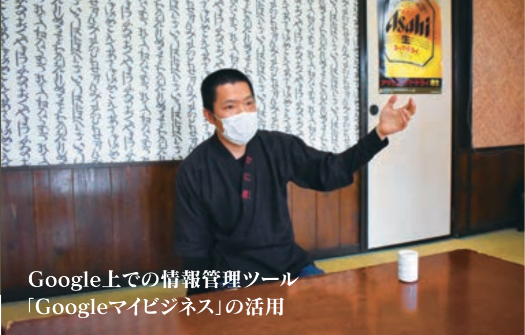
Google上での情報管理ツール 「Googleマイビジネス」の活用